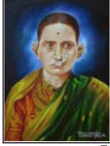
గంగూబాయి ఔరంగాబాద్ కర్