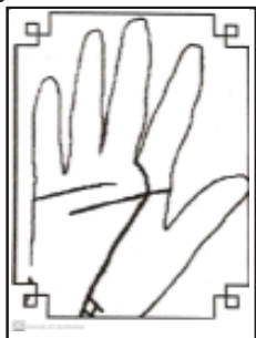
బాబా గీసిన అరచేతి పటము